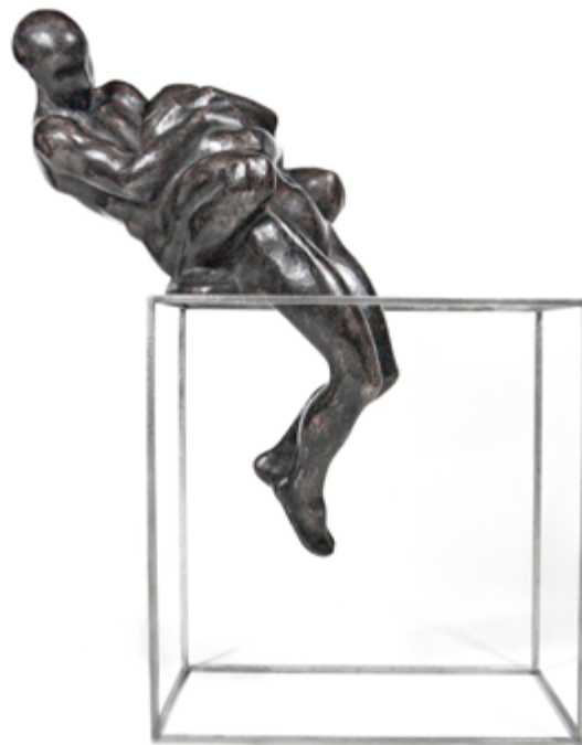
L'ASSENZA, 2020 Bronzo cesellato e patinato / Chiseled and patinated bronze

Se l'arte narrativa ha con il tempo un rapporto che l'arte plastica non può avere, nelle opere di Ana la dimensione dell'attimo in cui è bloccato il movimento sembra perdere i confini e spingersi lungo una linea del tempo che si espande abbracciando una narrazione più ampia e incontrando nuove forme d'arte.