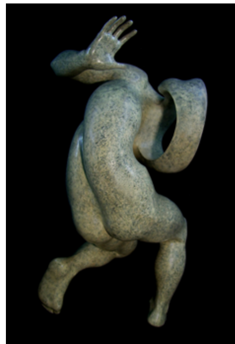
METAMORFOSI V - Serie II, 2009

Resina patinata e acciaio / Coated resin and steel