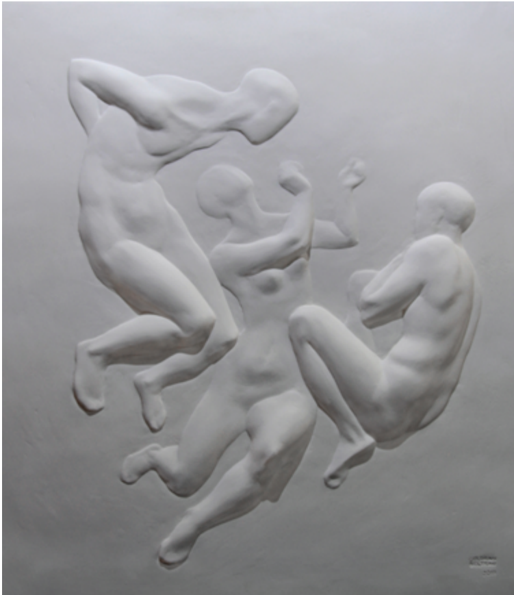
SPAZIO II, 2011 Resina sintetica bianca / White synthetic resin