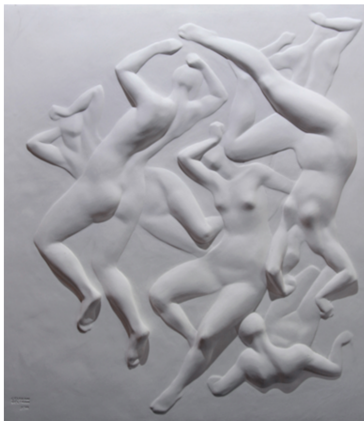
SPAZIO I, 2011 Resina sintetica bianca / White synthetic resin