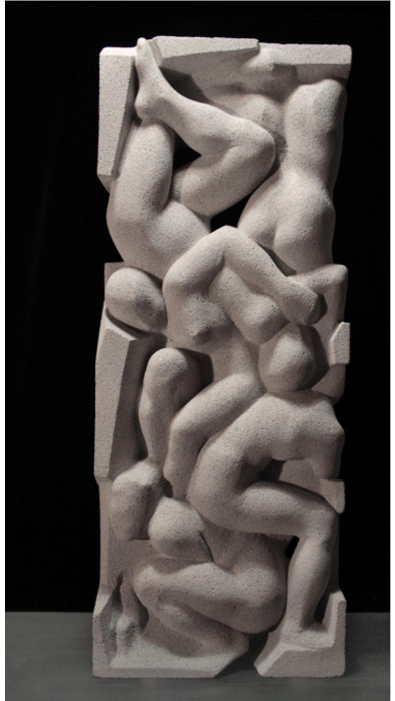
FORME III, 2014 Cemento soffiato / Foamed concrete