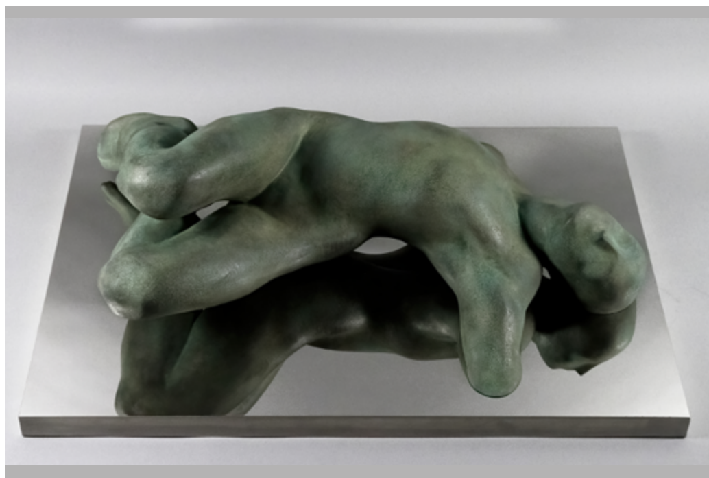
IL SOGNO, 2010

Resina patinata, bronzo e acciaio inox / Coated resin, bronze and stainless steel