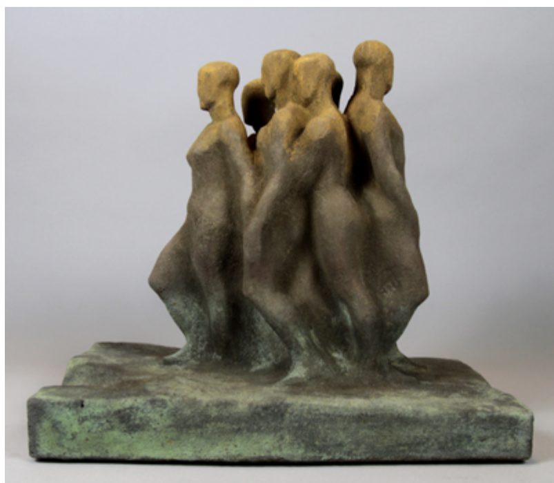
LA FOLLA, 2021 Resina sintetica patinata con polvere di bronzo / Synthetic resin coated with bronze powder