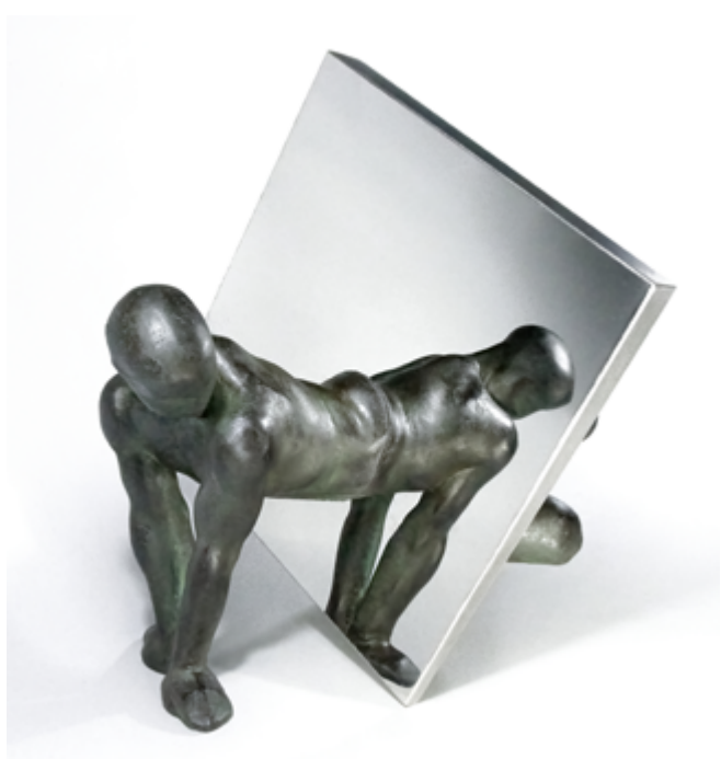
SPAZIO III, 2021

In a relationship of reciprocity, these two forms of art influence each other leading the observer to imagine, to hypothesize stories, to grasp the before and after of the moment immortalized by matter. If narrative art has a relationship with time that plastic art cannot have, in Ana's works the dimension of the moment in which movement is blocked, seems to lose its boundaries and push itself along a line of time that expands by embracing a broader narrative and encountering new forms of art.