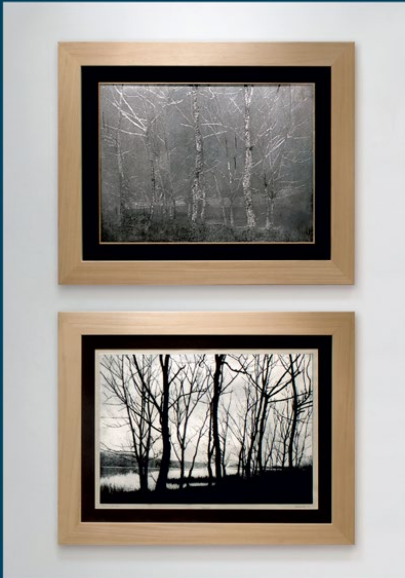
Massimiliano DRISALDI 'Inverno', puntasecca su alluminio cm 70x50