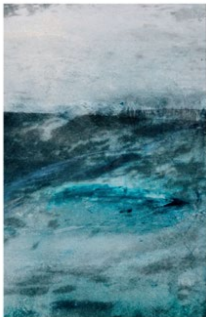
Figure indistinte e paesaggi infiniti emergono leggeri su alluminio. Immagini libere dalla prigionia del confine Shadowy figures and endless landscapes emerge light on aluminum. Free pictures from the imprisonment of the border