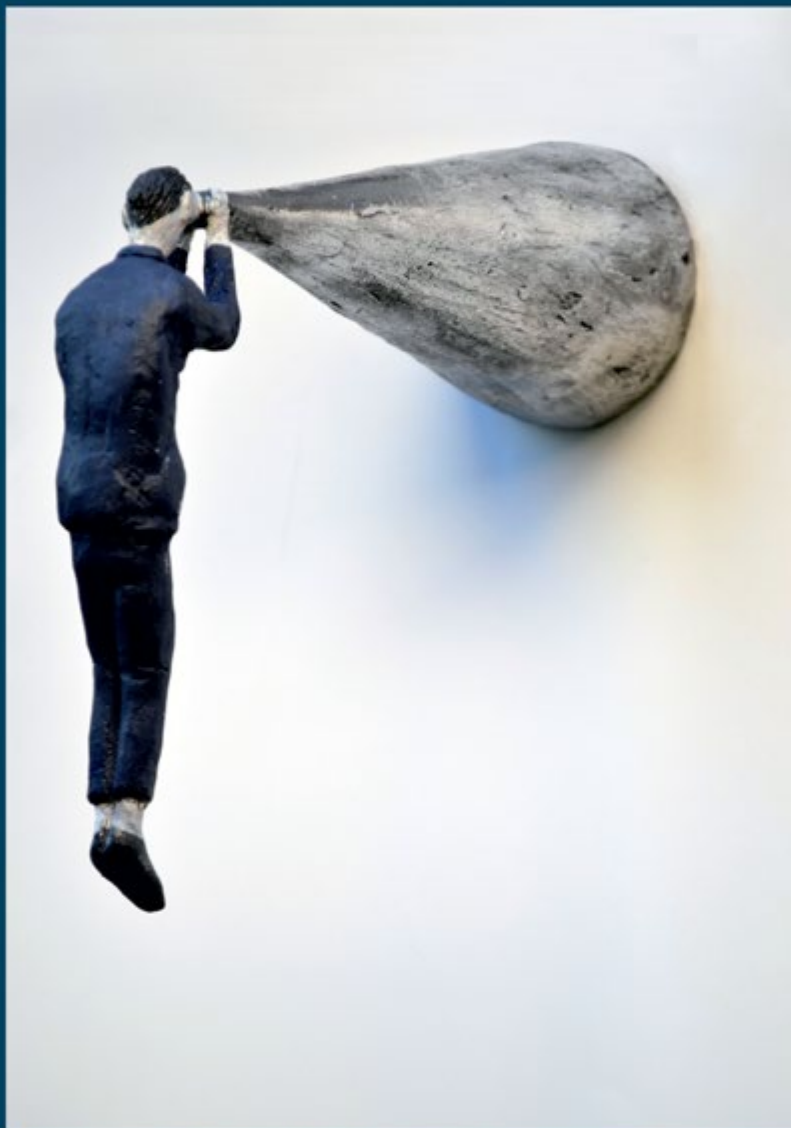
Pino DEODATO, 'Colui che vede lontano', alluminio policromo cm. 25x9x23