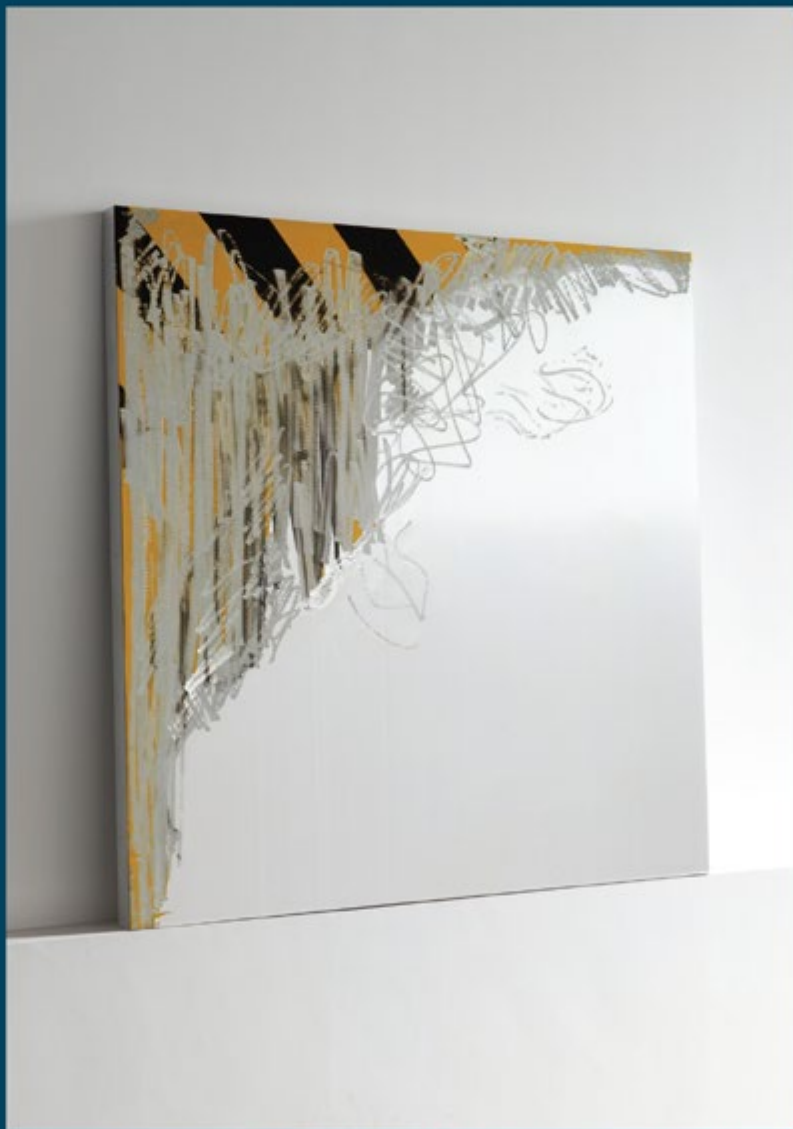
Tony CHARLES 'Fettled Sign', pittura, alluminio, resina cm 125x125